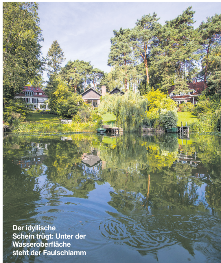
Der idyllische Schein trügt: Unter der Wasseroberfläche steht der Faulschlamm

Jetzt scheint Umweltstadträtin Schellenberg doch einzulenken, zumindest ein bisschen: „Es wird geprüft, ob es möglich ist, den stillgelegten Kanal wieder zu öffnen.“ Zudem führe sie Gespräche mit den Wasserbetrieben über eine Vorfilterung des eingeleiteten Regenwassers. Der Sprecher der Senatsumweltverwaltung sagt: „Denkbar wäre auch eine Begrenzung der Einleitung, um den Pegel nicht über ein bestimmtes Maß ansteigen zu lassen.“ Alle Optionen sollen nun technisch geprüft werden, damit das grüne Herz Zehlendorfs heilen kann.