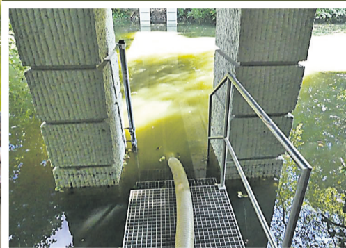
Zu spät ließ das Amt Wasser abpumpen ▼