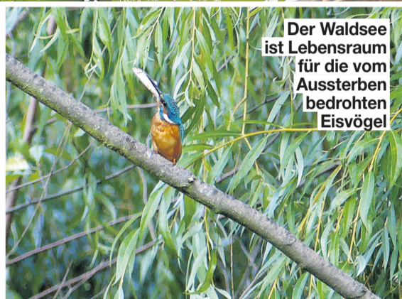
Der Waldsee ist Lebensraum für die vom Aussterben bedrohten Eisvögel

rungen für künftige Hochwassersituationen, um die noch vorhandenen Bäume zu schützen und das einstige Biotop wiederherzustellen. Am Waldsee leben zwei Paare des vom Aussterben bedrohten Eisvogels. Ihr Lebensraum ist gefährdet.