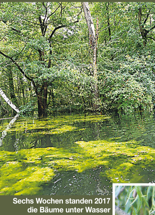
Sechs Wochen standen 2017 die Bäume unter Wasser